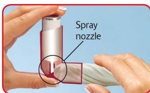
Orifice de sortie du spray